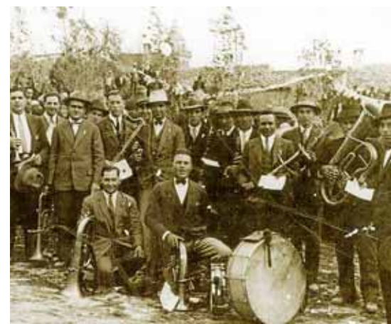
La música és un element fonamental a les festes.