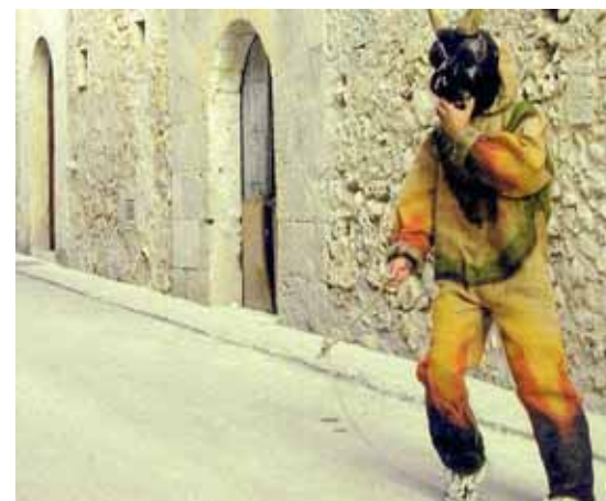
Els dimonis animen les cercaviles.