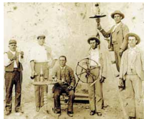
Els foquistes de Lloret sempre hi han estat presents.

xa del cert quines són les xifres oficials de lectors illencs en la nostra llengua, unes dades imprescindibles per saber cap on s'han de dirigir les polítiques lectores. El Govern informa que en breu s'iniciarà l'estudi. •