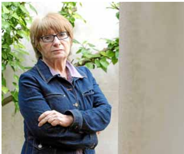
Vicens, una de les plomes candidates a Escriptor de l'any.

criptors illencs amb una carrera consolidada", explicà. "Tal com es fa als Estats Units o a Anglaterra, l'Escriptor de l'any donarà a conèixer l'escriptor i la seva obra mitjançant conferències, taules rodones, actes a les biblioteques, etc..", afegí. Els noms de Baltasar Porcel, Antònia Vicens, Carme Riera o Gabriel Janer Manila són els que perfilen per ser-ne els candidats.