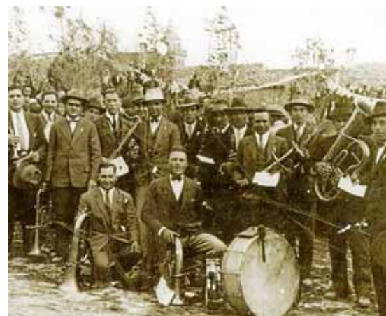
La música és un element fonamental a les festes.